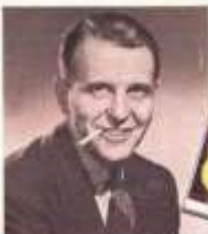
RALPH BELLAMY reports: "Camels suit my taste and throat. I've smoked 'em for years!"