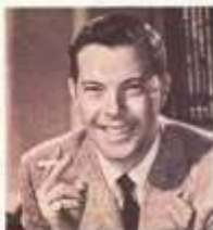
DICK HAYMES states: "I get more pleasure from Camels than from any other brand!"