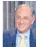
Colicchia Un figlio aiuta a guarire

* Segretario Aipf (Associazione Italiana Protezione della Fertilità)