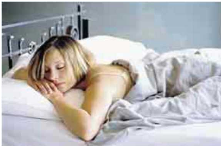
IL SONNO Dedicare due giorni a settimana al recupero del riposo

Oltre il dormire, nuove cure per il diabete: le staminali come possibilità di giorno in giorno più vicina. È quanto spiega la Società italiana di diabetologia (Sid) che in un documento esamina tutti i filoni di ricerca in corso nel mondo. «Lo dimostra il fatto - ricorda Lorenzo Piemonti, Diabetes Research Institute-IRCCS Ospedale San Raffaele e coordinatore del Gruppo di studio "Medicina rigenerativa in ambito diabetologico" della Sid - che nel 2014 è iniziata la prima sperimentazione nell'uomo, utilizzando cellule produttrici di insulina, derivate da staminali. Sono in fase di traslazione nell'uomo almeno altri tre approcci simili. La medicina rigenerativa ha la potenzialità non solo di trattare, ma di guarire in modo definitivo il diabete».