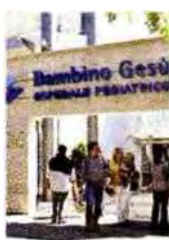
Il "Bambino Gesù"

ROMA. Le ricette, una lettera di accredito del ministero della Sanità e il contratto con l'ospedale pediatrico Bambino Gesù. Tutto falso. Dovrà rispondere di esercizio abusivo della professione e truffa una finta pediatra specializzata in oncologia di San Basilio, quartiere alla periferia Nord Est della capitale. Denunciata dalla polizia, nel suo studio la 40enne prescriveva cure tanto costose quanto inutili a bambini e a malati di tumore. Per costruire il suo personaggio, al muro aveva appeso anche gli attestati di stima firmati dall'ex ministro Umberto Veronesi e dall'immunologo Fernando Aiuti.