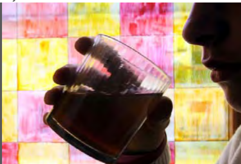
Abbuffata alcolica per 3,3 mln italiani, anche a 11 anni

Binge drinking tra adolescenti, allarme Ministero Salute