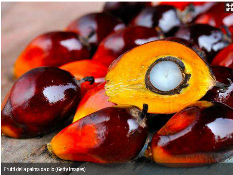
Frutti della palma da olio