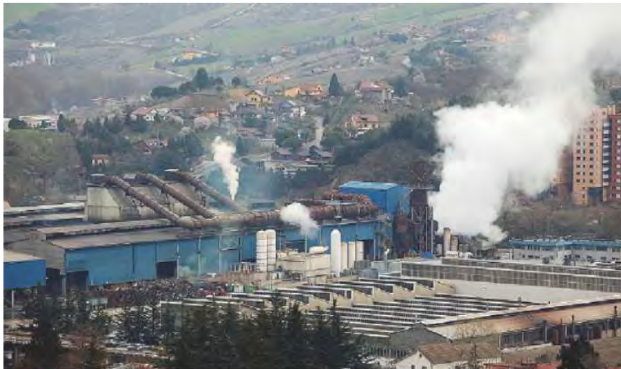
I COSTI L'inquinamento genera una spesa sanitaria non inferiore a 330 miliardi l'anno