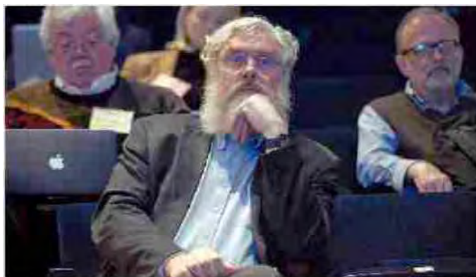
George Church, genetista della Harvard University

Da parte sua, George Church, uno degli organizzatori dello Human Genome Project-Write, sostiene che diventerà più semplice sintetizzare il Dna partendo da zero, senza ricorrere all'editing genetico, «che non sempre funziona». Il «climax» della biologia sintetica - a suo dire - sarà fabbricare genomi umani immuni ai virus. E alle obiezioni di chi rabbrivisce all'idea di esseri umani sintetici dice che la biologia di sintesi potrà reinventare la natura e noi stessi, in una seconda genesi o «Regenesis» (come recita un suo bestseller). Del resto Church è un «transumanista»: appartiene alla scuola di pensiero che profetizza il miglioramento delle capacità fisiche e cognitive dell'uomo attraverso l'uso di scienza e tecnologia.