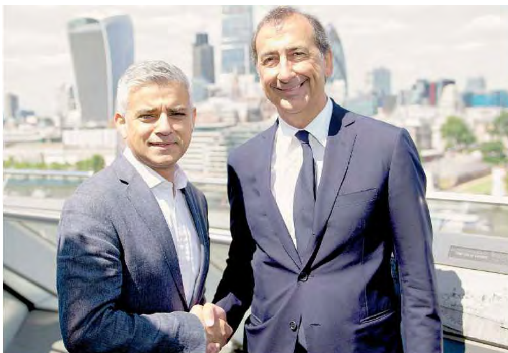
La stretta di mano. Il primo cittadino di Londra Sadiq Khan e il sindaco di Milano Giuseppe Sala ieri nella City

■ Il piano del Comune di Milano per attrarre gli investimenti di agenzie e multinazionali nell'area Expo