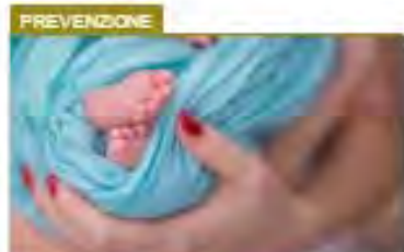
Foto Consigli per abbronzarsi in sicurezza Video L'esperta: "Protegersi fin da piccoli" Diagnosi in aumento sotto i 40 anni di IRMA D'ARIA