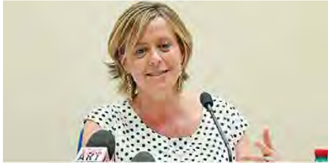
Il ministro Beatrice Lorenzin