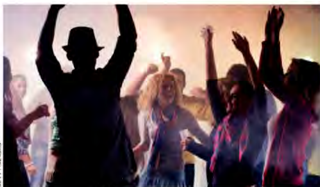
DISCOTECHES E LUOGHI CHIUSI E AFFOLLATI FACILITANO LA TRASMISSIONE DEI BATTERI TRASPORTATI, NEL CASO DELLA MENINGITE, DA GOCCE DI SALIVA