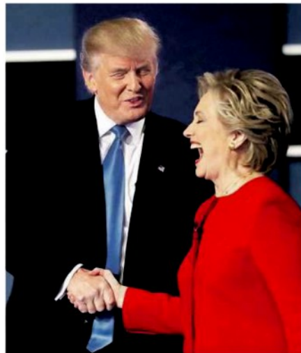
La stretta di mano tra Donald Trump e Hillary Clinton