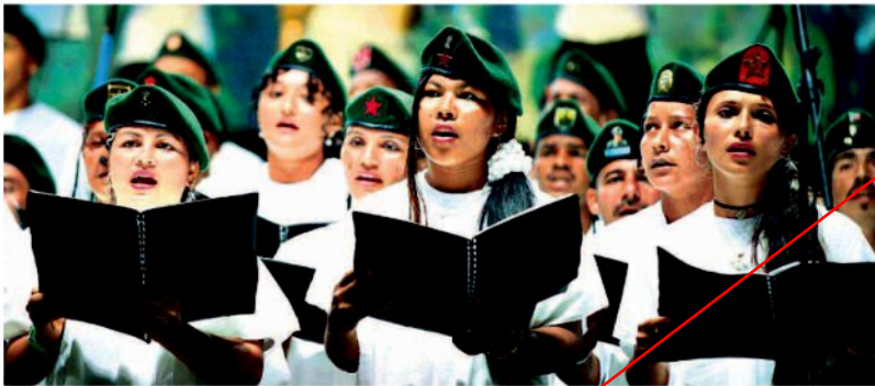
Un coro di guerriglieri canta in occasione dell'accordo di pace firmato ieri tra il governo colombiano e le Farc