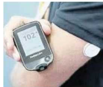
IL DISPOSITIVO Flash della Abbott