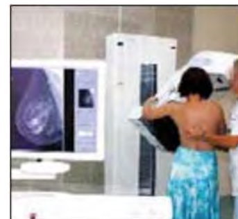
MAMMOGRAFIA Strumento efficace