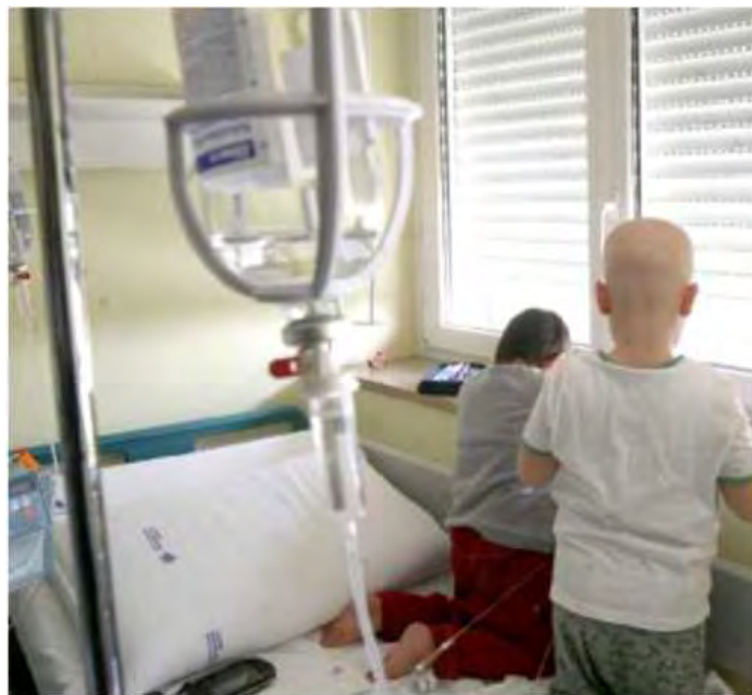
Bambini ricoverati in oncologia

Un «Patto contro il cancro» capace di mobilitare risorse e di dare una risposta concreta alle richieste di tre milioni di pazienti, sul modello di programmi già lanciati negli Stati Uniti. L'Aiom, precisa il presidente, «è partita da proposte strutturali a lungo termine e, nel breve periodo, con una proposta concreta: l'istituzione di un Fondo nazionale per l'Oncologia». •