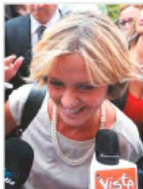
NO TAGLI il ministro della Sanità Beatrice Lorenzin