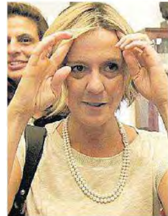
Il ministro Beatrice Lorenzin

Programmi di miglioramento e riqualificazione. Le Regioni, anche quelle commissariate e con piani di rientro possono presentare programmi di miglioramento del livello delle prestazioni che saranno approvati dalla Commissione LEA del ministero della Salute entro il prossimo marzo. Le Regioni che attuano questi programmi potranno avere un premio pari allo 0,1% del Fondo sanitario nazionale (oltre 112 milioni di euro).