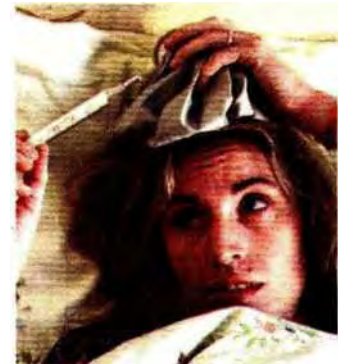
LIBIA L'influenza arriva dall'Africa