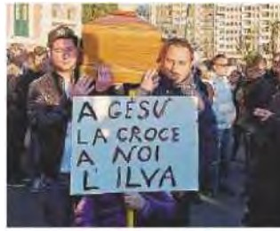
In piazza per Taranto