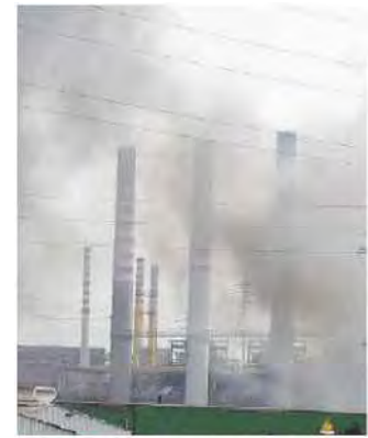
Non solo Ilva L'impianto Ansa