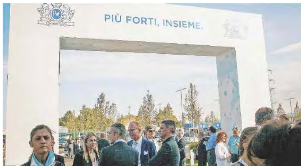
Il colosso Usa Lo stabilimento Philip Morris a Valsamoggia, inaugurato con Matteo Renzi

La quota del mercato italiano in mano a Philip Morris (che, tra l'altro, controlla il marchio Marlboro). Era del 53% un anno fa, ma è stata insidiata da Jti (Camel)